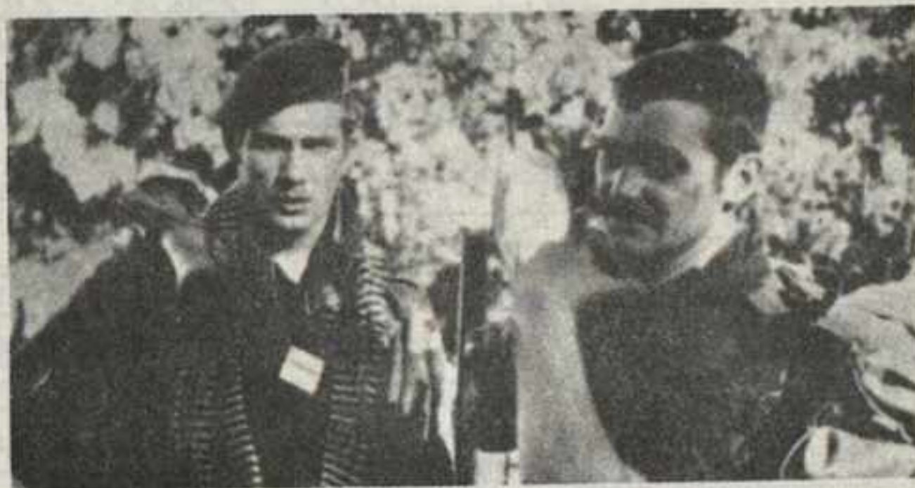
La política de los cañoneros ha sido sustituida por la política de los paracaidistas. Soldados franceses durante la intervención franco-belga en el Congo.