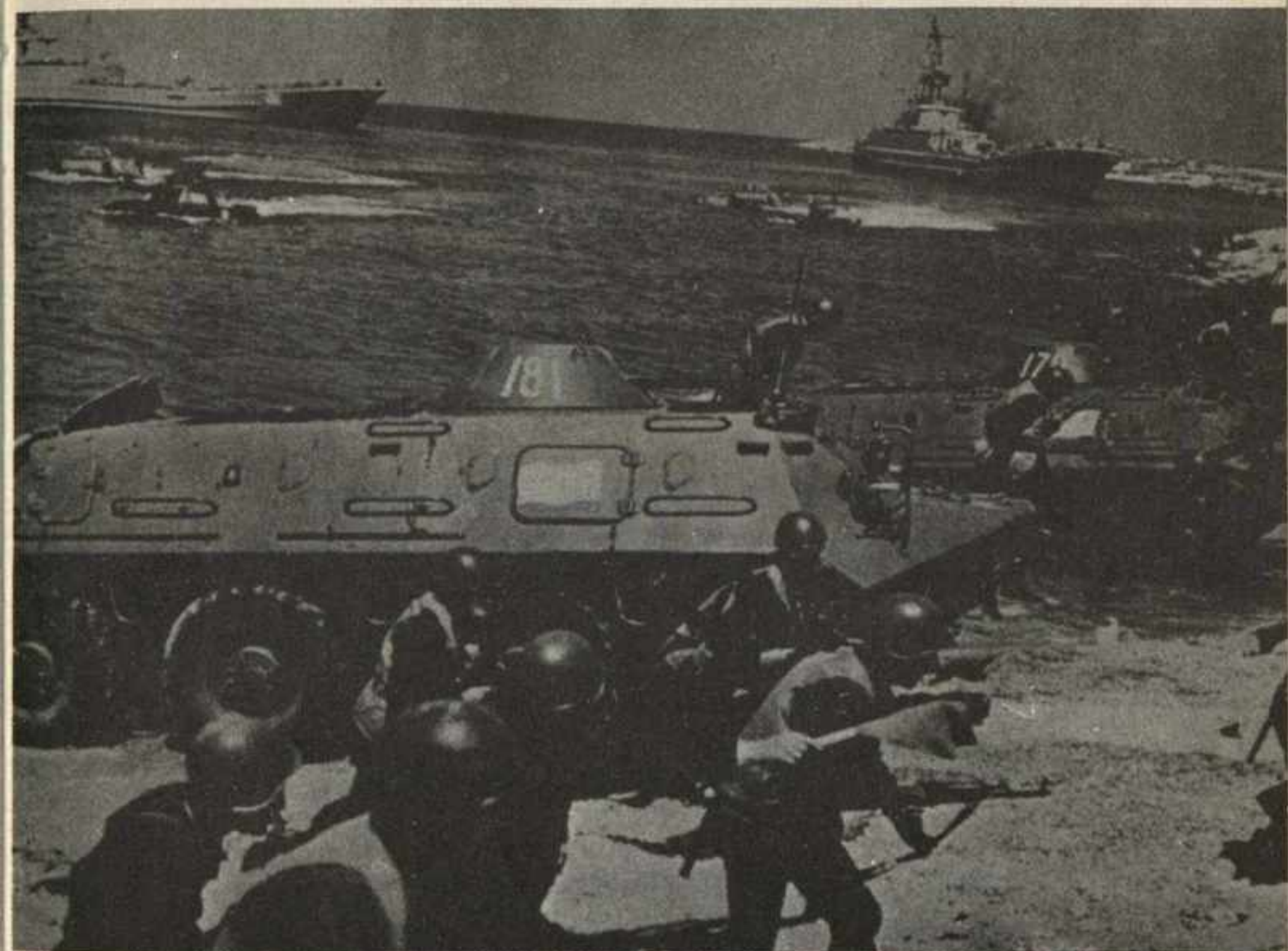
La OTAN es una alianza agresora que se prepara sistemáticamente para la defensa de los intereses imperialistas. En la foto, tropas conjuntas germano-francesas en un simulacro de desembarco en costas francesas.

ques que defiende el Movimiento Comunista no supone sin embargo una posición pasiva ante la expansión y las agresiones contra los trabajadores y los pueblos. Antes al contrario la neutralidad ante los bloques y el no alineamiento en ninguna de las esferas de poder que se reparten el mundo debe de ir acompañado de un compromiso internacionalista con las luchas de los trabajadores de todo el mundo y los movimientos revolucionarios de liberación nacional y antiimperialistas que se desarrollan hoy y se desarrollen en el futuro.