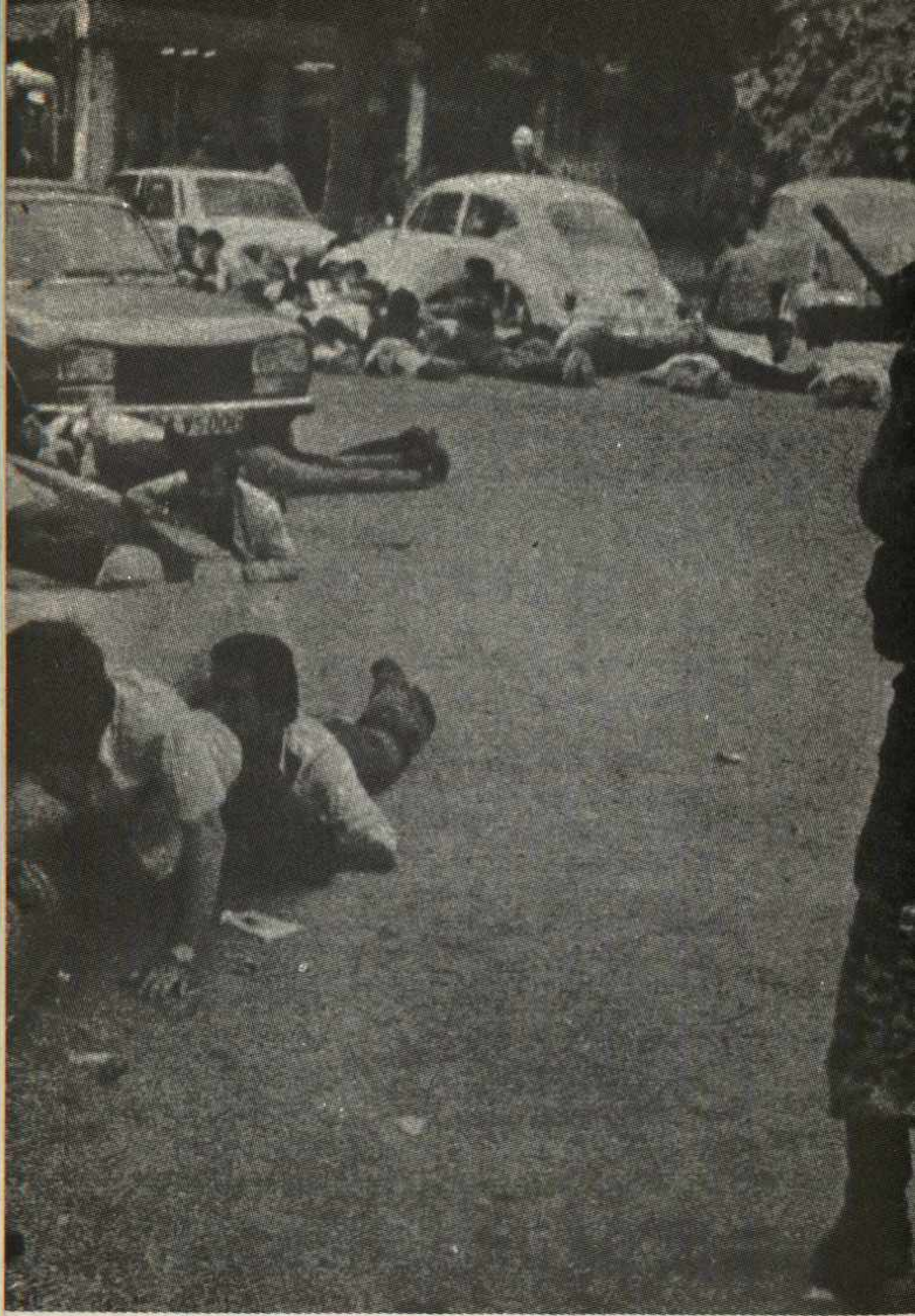
Represión policial y ultraderechista en TURQUIA. La OTAN trata de impedir por todos los medios el ascenso del movimiento revolucionario en los países que forman su zona de influencia.