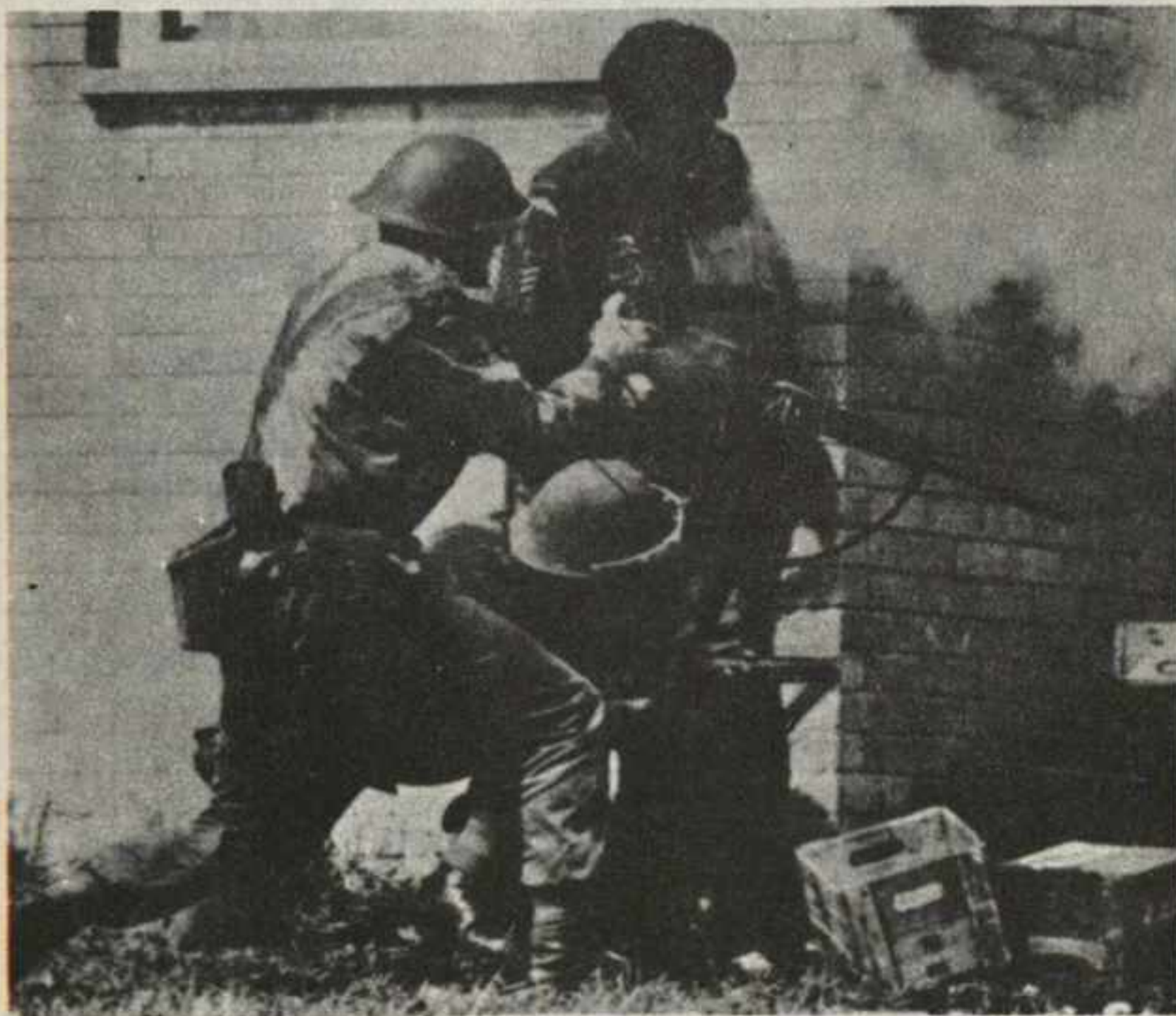
Soldados ingleses en plena batalla contra las fuerzas del IRA. Las actividades contrarrevolucionarias son una importante función de las tropas de la OTAN.

Por último hay quien opina que probablemente al imperialismo occidental le sea más útil una política internacional española, prácticamente alineada al bloque occidental pero formalmente neutralista. De esta forma podrían mantenerse las bases USA en territorio del Estado español, pero no habría obstáculos, por ejemplo, para que el capitalismo español fuera un puente entre América Latina y los países árabes por un lado y el imperialismo occidental por otro.