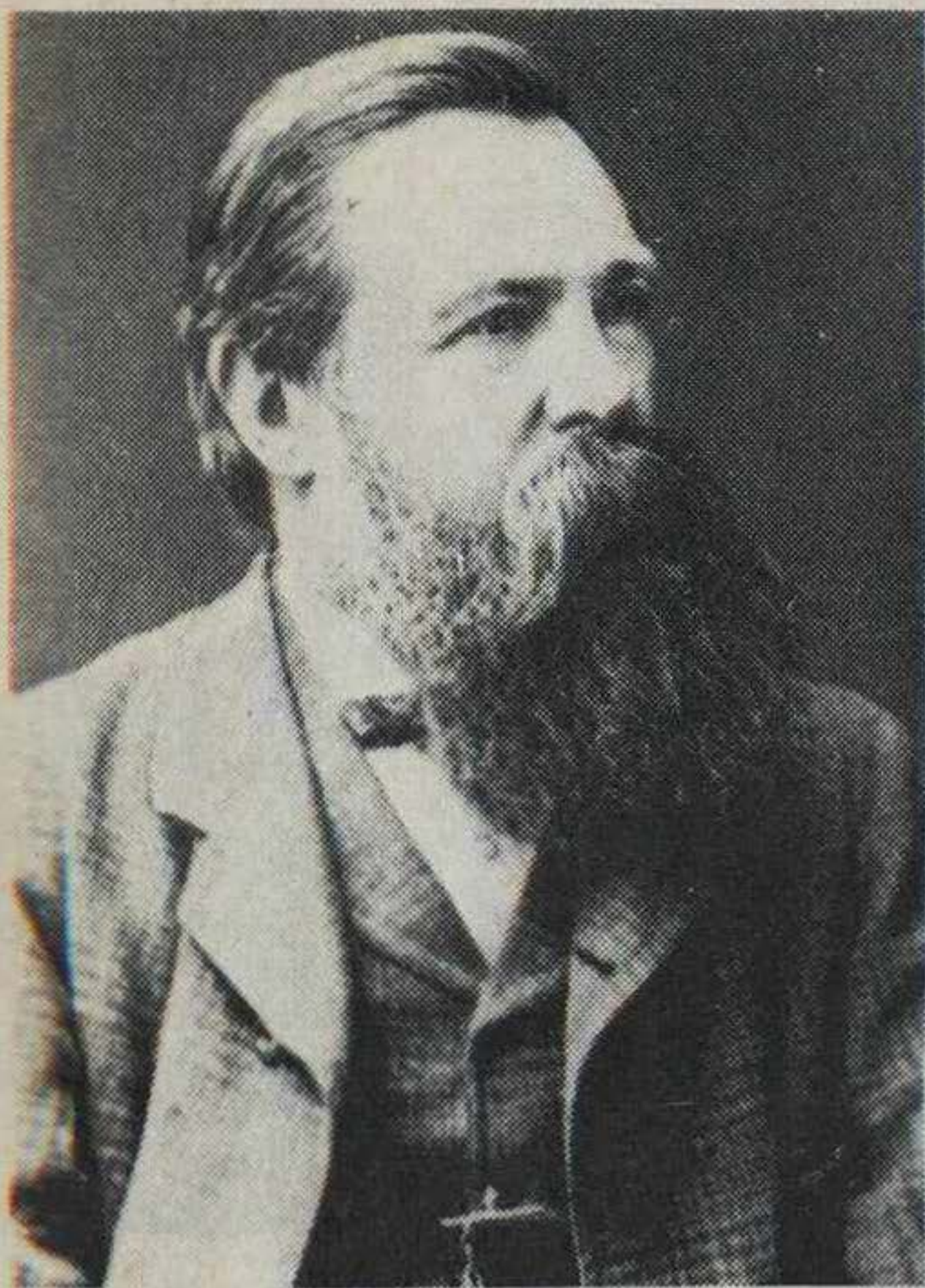
F. ENGELS (1820-1895)