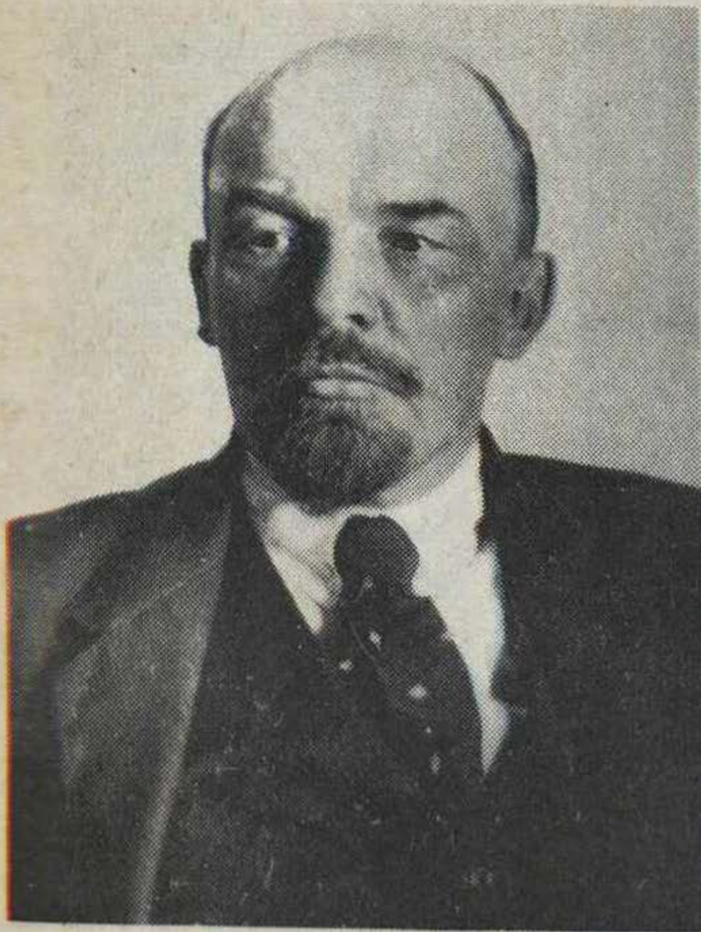
V.I. LENIN (1870-1924)