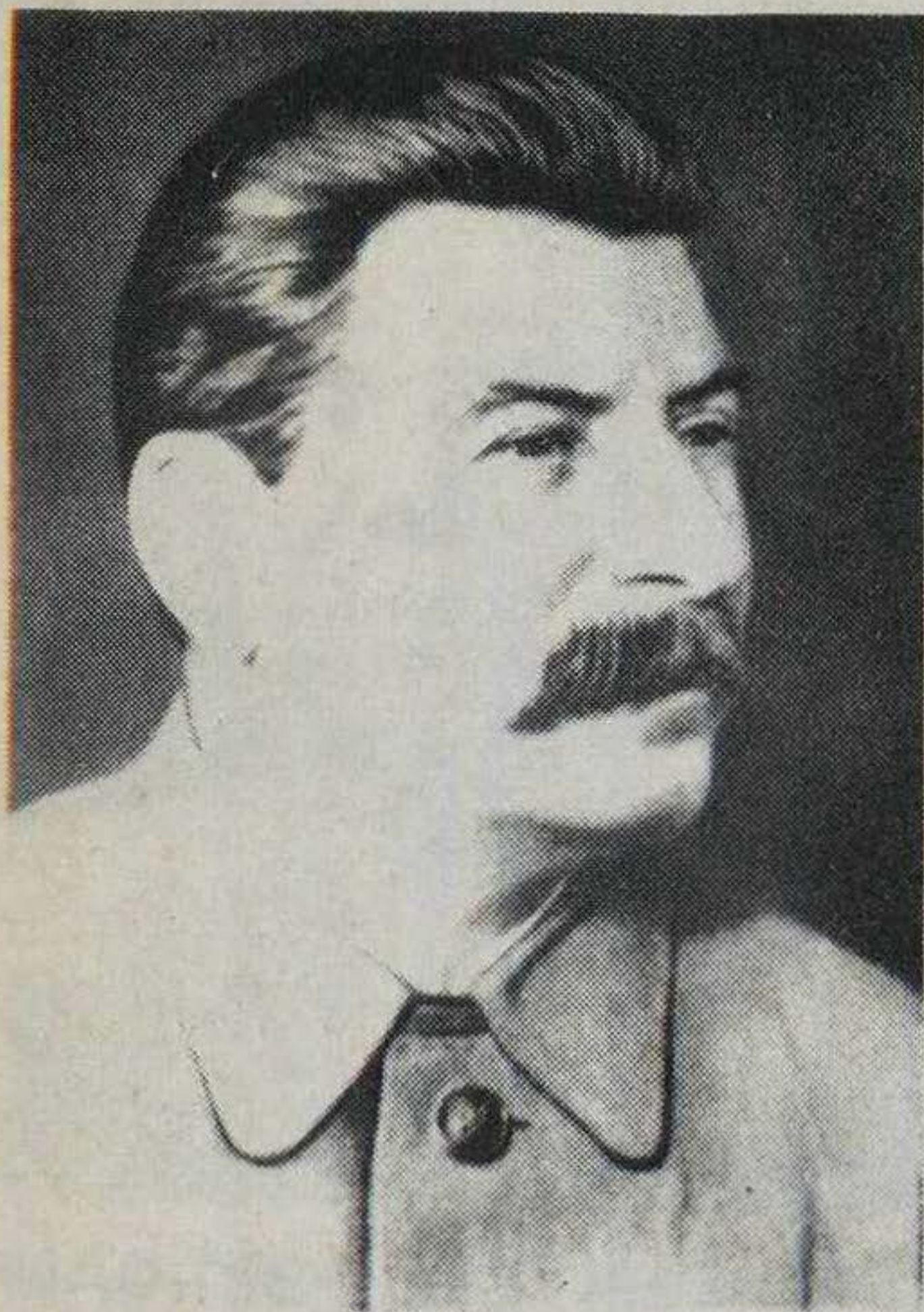
JOSE STALIN (1879-1953)